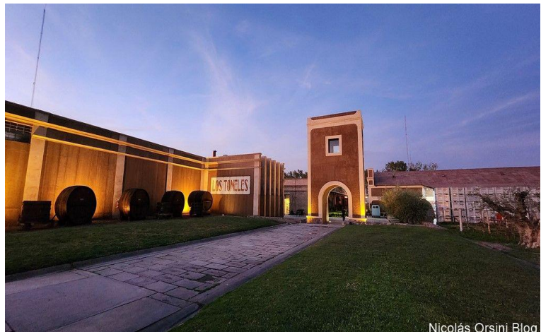
Nicolás Orsini Blog

Declarado patrimonio cultural de la provincia de Mendoza, se erige Bodega Los Toneles. Ubicada en el Gran Mendoza, departamento de Guaymallén, a sólo 10 minutos del microcentro, cuenta con una oferta única de experiencias en torno al vino. En un ambiente clásico y de distinguida elegancia, deleita y sorprende al visitante.